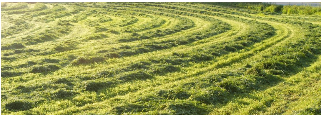
Bilde 16 Smittevernplanen skal omfatte alle deler av driften. Sjekker du opprinnelse og kvalitet på innkjøpt fôr?

En smittevernplan kan være nyttig i arbeidet med å hindre smitte til egne dyr og til besøkende i dyreholdet, også i dyreparker og sirkus, og ikke minst på besøksgårder, der de besøkende har tettere kontakt med dyra på gården.